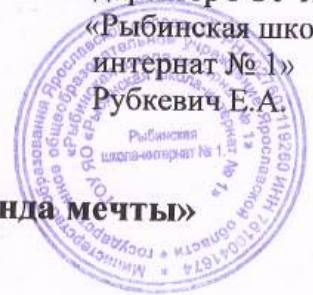
График работы школьного театра «Команда мечты»