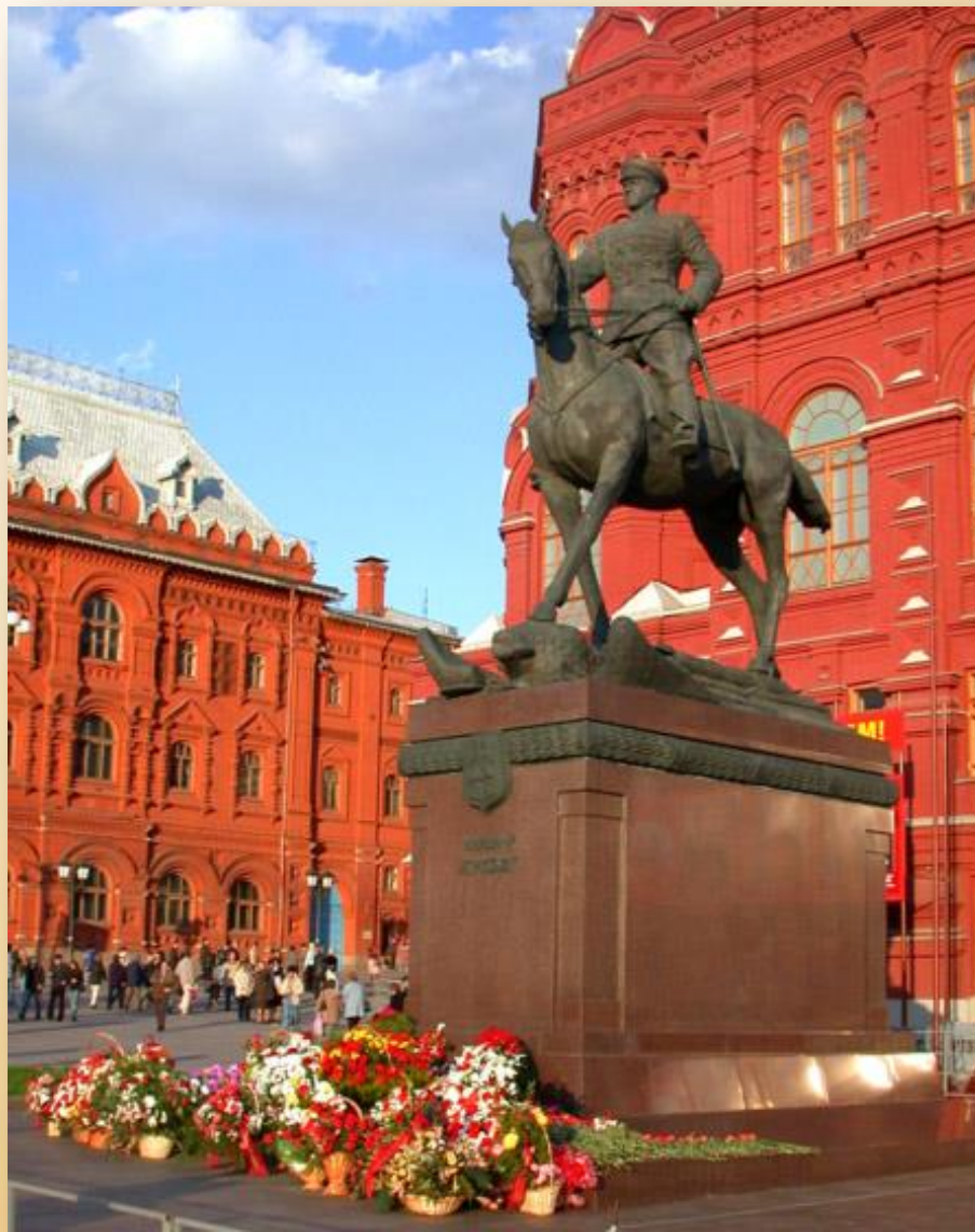
Памятник Г. К. Жукову на Красной площади в Москве