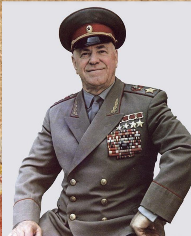
Георгий Константинович Жуков