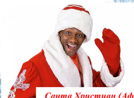
Санта Христиан (Африка)