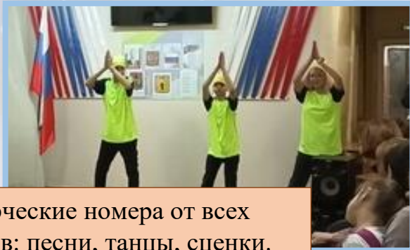
Творческие номера от всех классов: песни, танцы, сценки.